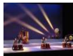
第20回和太鼓演奏会ながと