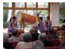
和のスヌーズレン