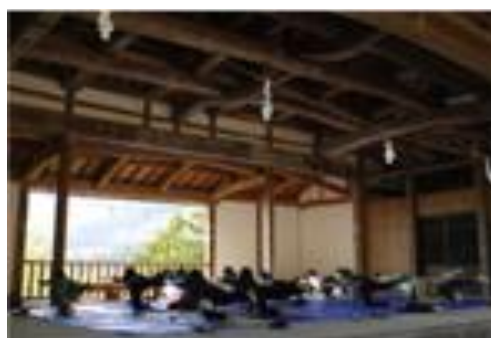
【聖地体験の様子・ヨガ】