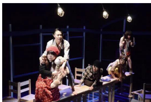
百景社『銀河鉄道の夜』公演写真