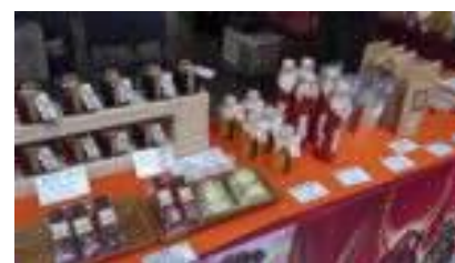
【宣伝イベントの様子 (多摩プラザ)】