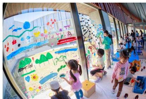
【プログラムの様子】 アソビジュツ！ 美術館のガラスに絵を描こう！

美術を難しく考えず、体全体を使って素材に触れて楽しむプログラムや通年・連続した講座で経験を重ね、創造力や表現力を育むプログラム、そして幼稚園・保育園や小学校に来館いただき、普段の園や学校生活では行うことが難しい創作活動を美術館で体験するプログラムなどを実施しながら、子どもたちの考える力や豊かな感性を育みます。