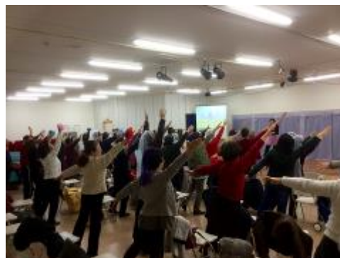
【テキスト配布・研修会の様子】