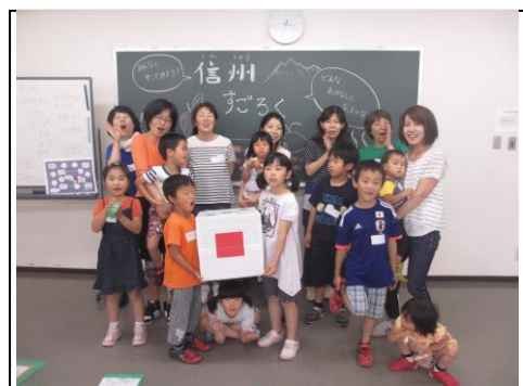
【わくわく信州体験隊】 信州すごろくをあそぶ

核家族化や少子化、地域のつながりの希薄化に加え、ネットやゲームなどにより、子どもたちのあそびや関わりが複雑化・歪曲化している中で、子どもから大人までがあそびを通して関わり合い・関わることの豊かさを実感していく、「子どもから大人のあそび交流活動」を実施。さらに、子どもとの関わりやあそび環境を考えるため、子どもに関わる大人向けワークショップ・シンポジウムなどの「遊育環境を考える大人向け研修活動」を行った。 (1)わくわく信州体験隊 × 4回 (2)地域を遊ぶ！～子どもから大人のあそび合い～ × 6回 (3)子育てシンポジウム子どもの育ちとあそびのチカラ × 1回 (4) 大人対象ワークショップ 広がれ！あそび心講座 × 4回