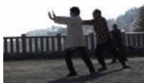
【聖地体験の様子・太極拳】

太極拳は北向観音という立地がアクセスが良く、無料なため特に地域の参加者が多かった。目標90名に対して61名と参加者は減少してしまったが両体験とも人数の減少はイベントや行事、天候と重なり予定回数の20回から15回の実施になったことも目標比から減少の理由ともなるが、昨年からのリピーターや旅館への宿泊者、信州DCにからめた宣伝などで夏場は特に増加した。今後は、各旅館や昼・夜の時間帯でも様々な場所で体験ができるよう検討したい。