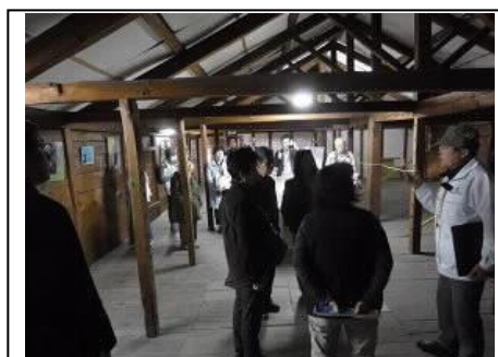
【モニターツアーの風景】

観光ミニシンポジウムでモニターツアー実施、観光案内アプリ開発の事業成果を報告した。さらに、ミニシンポジウムの記録と事業成果を最終報告書にまとめた。