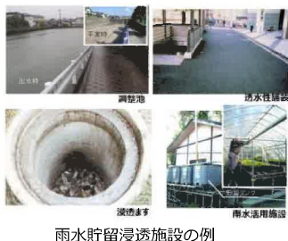
雨水貯留浸透施設の例