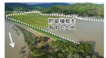
貯留機能を有する土地のイメージ