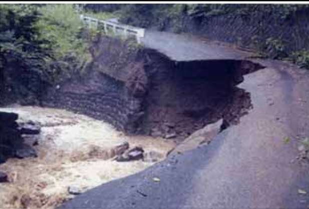
路肩崩落状況(村道入田沢線) 青木村弘法