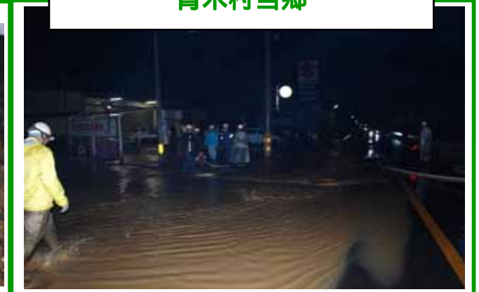
道路冠水状況((国)143号) 7月3日 P.M. 11:00頃 青木村当郷