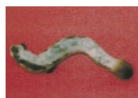
マジックマッシュルーム