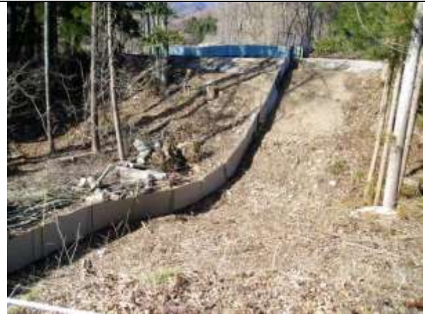
同左：緩衝帯整備により森林側に空間を確保