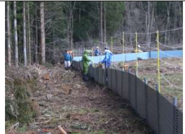
同左：緩衝帯整備により設置が楽