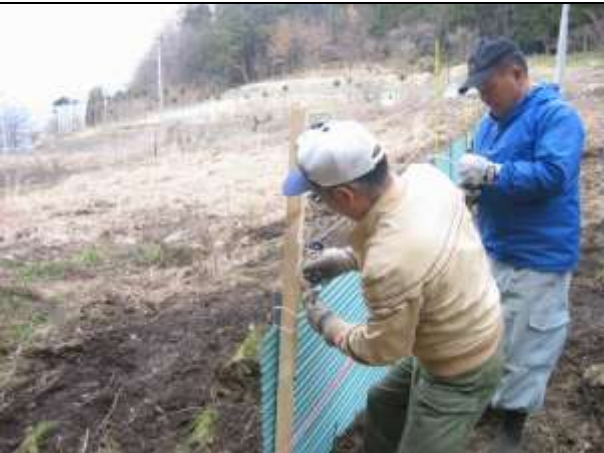
地域住民による設置