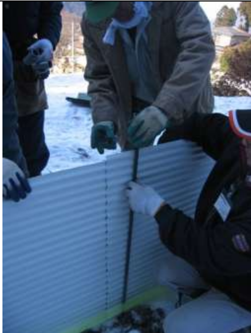
業者と鳥獣害対策委員会による試験設置