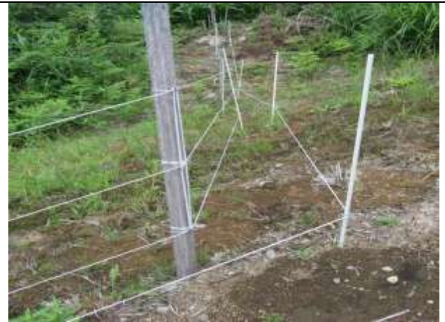
外側にトリップラインで補強