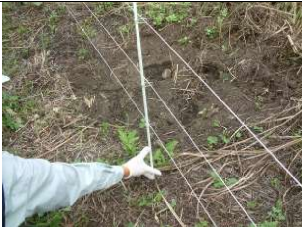
電気柵の下を掘って侵入した跡