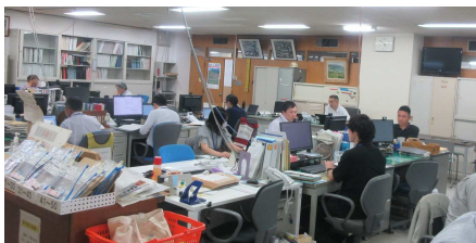
【これまでのレイアウト】