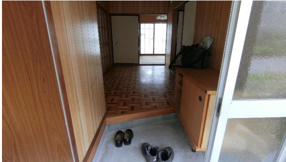
玄関・玄関ホール