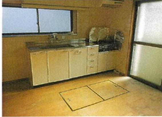
ダイニング・キッチン