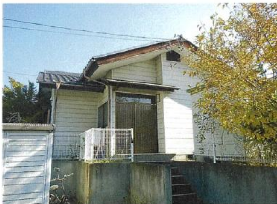
西面 (2) 居宅部分玄関付近