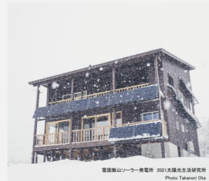
雪国飯山ソーラー発電所 2021太陽光生活研究所

（※）除雪が行われている場所である場合には、太陽電池アレイを地表上2メートル（一般電気工作物の場合は1メートル）以上とすることができる